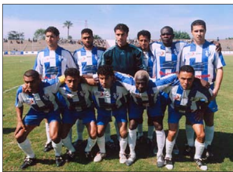
L'IRT qui a déçu par sa prestation en coupe face à l'OCK Khouribga.

Sincèrement, l'OCK n'a jamais battu l'IRT par ce score-fleuve