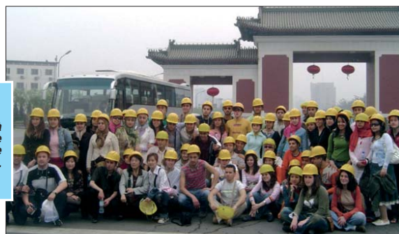
Visite à une grande entreprise chinoise.