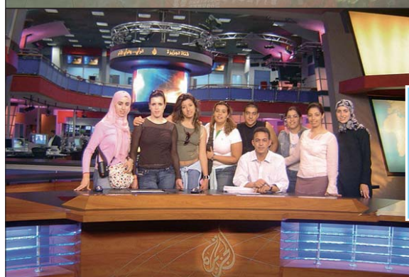
Sur le plateau officiel de la chaîne de télévision Al-Jazeera au Qatar.