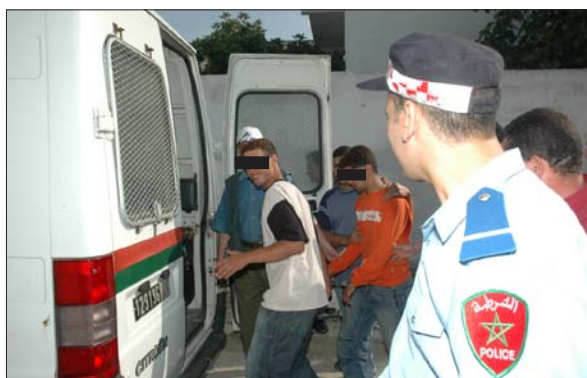
Les deux présumés assassins embarqués à bord d'une estafette de la police.