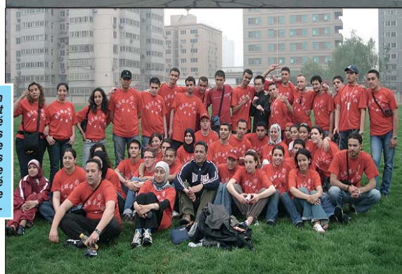
Match de foot organisé entre les étudiants de EHECT et les étudiants de l'Université internationale de Pékin.