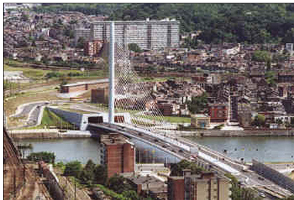
La métropole de Liège (Belgique).

Les villes de Tanger et de Liège (Est de la Belgique) sont désormais unies par un accord de partenariat, conclu mercredi par les maires des deux cités, et qui sera appelé à approfondir la coopération et les échanges entre la ville du détroit et la cité ardennaise.