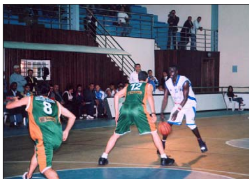
Le pivot de l'IRT Papis, en action.

Après le premier round de la finale de la Coupe du Trône réussi par l'ittihad de Tanger au complexe Moulay Abdellah de Rabat face au Raja de Casablanca, les deux équipes, révélations incontestables cette année, tant en championnat qu'en Coupe du Trône, se rencontreront de