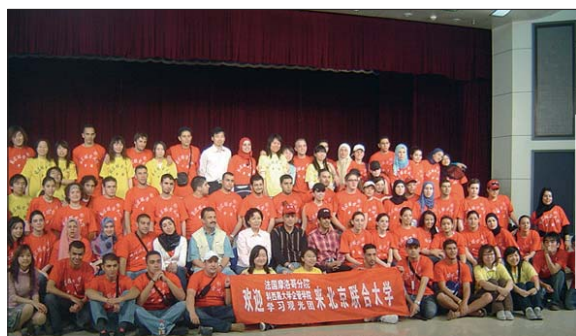
Les étudiants avec leurs camarades chinoise

— Y.M. : Le coût est supporté à 80 % par l'école, ce qui ne laisse que 20 % comme charge aux participants au voyage, sachant cependant que les majors de chaque classe sont entièrement pris en charge par EHECT et ne paient donc rien.